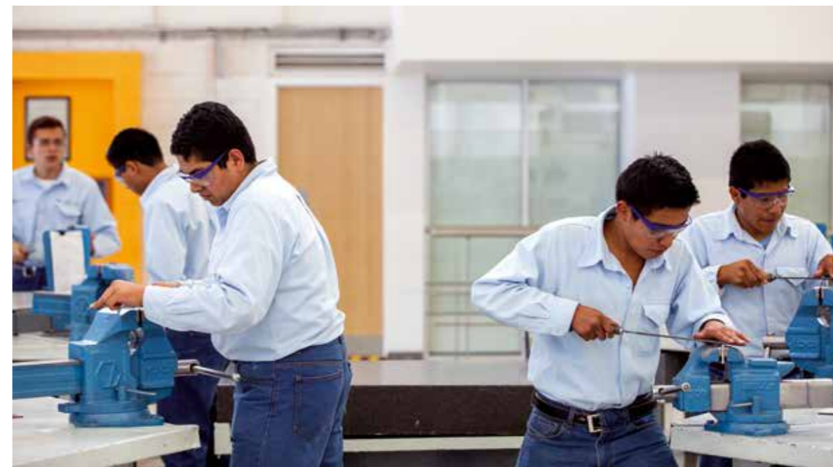
Empleados elaboran objetos en el tornillo de banco en el Centro de Capacitación.