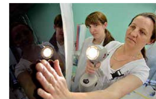
Lámpara de luz diurna: En la pintura se buscan hologramas y zonas pulidas.