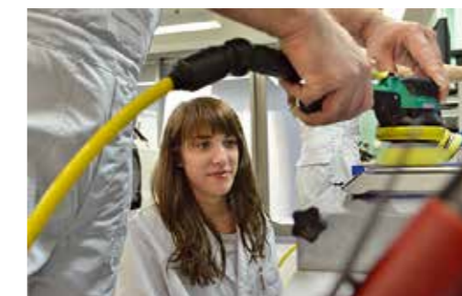
Máquina pulidora: La presión correcta se practica sobre una balanza de cocina.