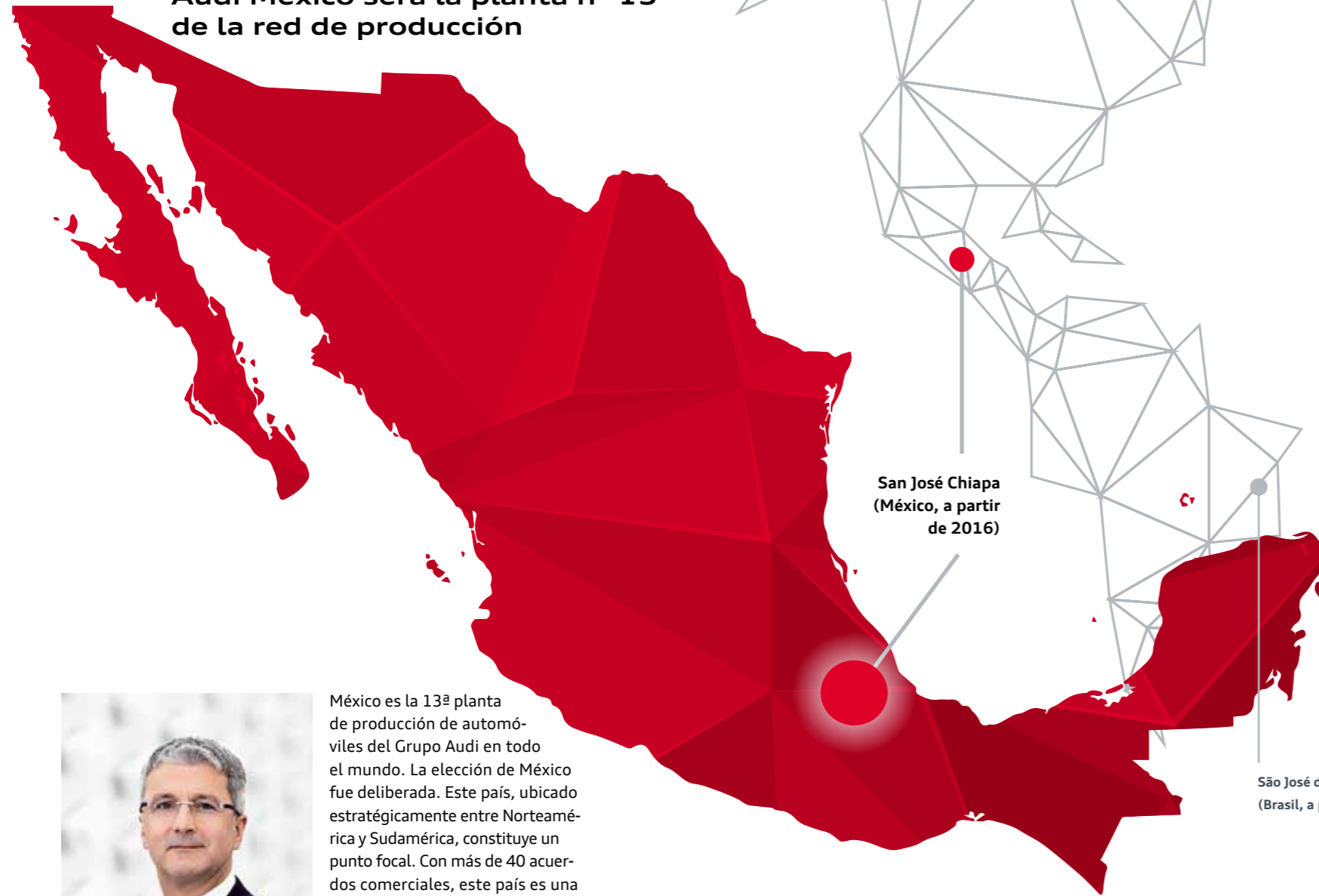
San José Chiapa (México, a partir de 2016)

Audi México será la planta n° 13 de la red de producción