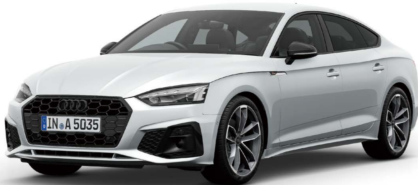
Audi A5 Sportback 35 TDI S line Meisterstück*1

黒とグレーのディテールで内外装をスポーティ&エレガントに仕上げた “傑作”の名に相応しい特別仕様車。