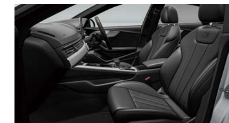
スポーツシート (フロント) / ファインナップレザー