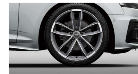
アルミホイール 5スポークSデザイン グラファイトグレーポリッシュ 8.5J×19+255/35R19タイヤ

*2 Audi A5 Sportback 40 TDI quattro S line Meisterstück、A5 Sportback 45 TFSI quattro S line Meisterstückにオプション。 ※掲載の装備内容は一部抜粋となります。詳しくはData Informationをご覧ください。※写真は欧州仕様です。日本仕様と異なります。※写真はイメージです。