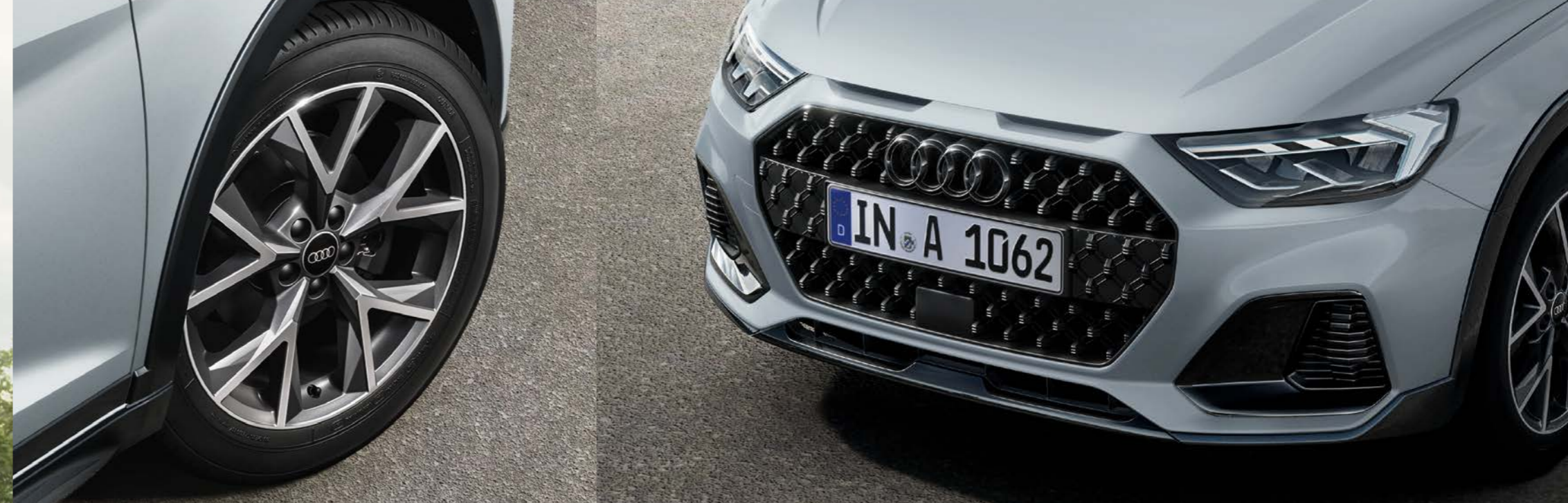
アルミホイール 5スポーク Yスタイル グラファイトグレー 7Jx17+205/55 R17タイヤ