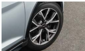
アルミホイール 5スポーク Yスタイル グラファイトグレー 7J×17+205/55 R17タイヤ