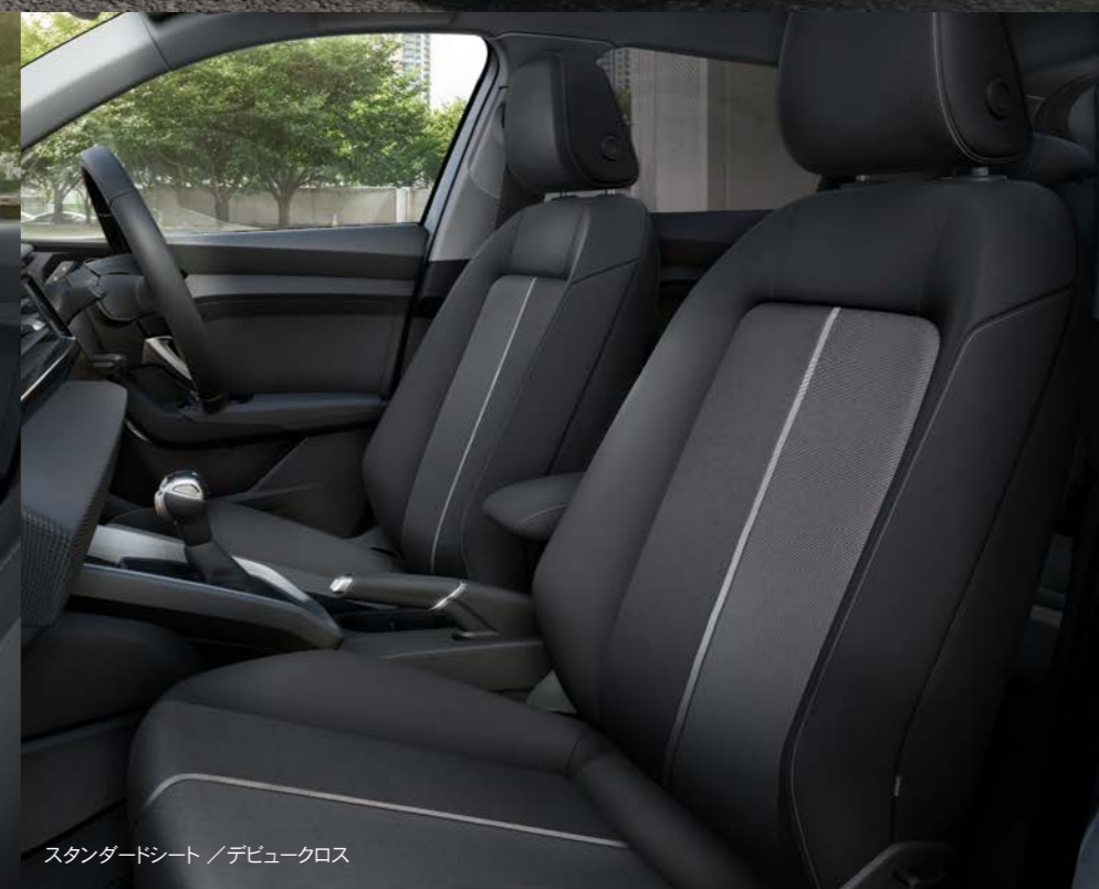
スタンダードシート /デビュークロス