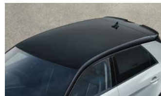
コントラストルーフ(ミトスブラック メタリック)